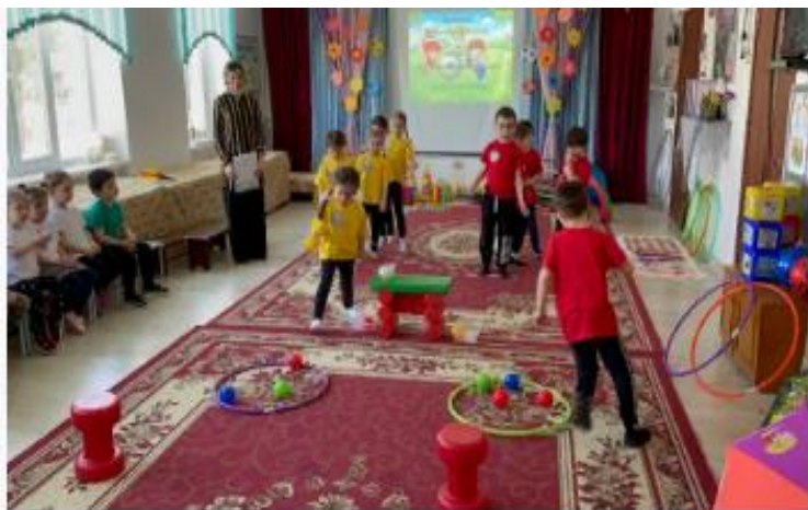
Средняя группа №1