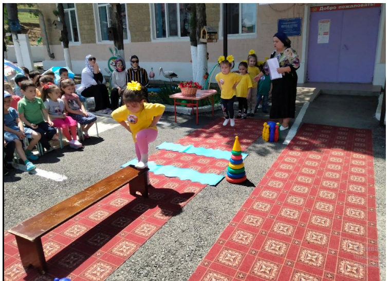
Младшая группа №2