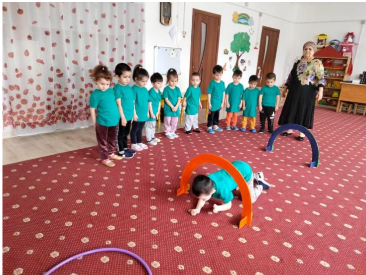
Младшая группа №1